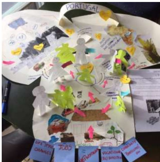
Curso de Formação "Connected recognition", Lituânia

nível europeu no âmbito do Programa Erasmus+ e, por último, fortalecer a sua rede de contactos e parcerias.