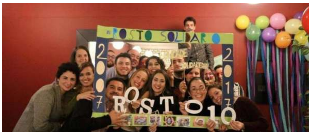
Comemoração do 10º Aniversário da Rosto Solidário, novembro de 2017

Em 2017 foram promovidas várias atividades de angariação de fundos, como feirinhas solidárias, flores de papel, entre outros. Mantiveram-se ainda caixa de donativos, a angariação de novos sócios e doadores e estratégias de fidelização dos mesmos, aumentando o número de quotas e donativos.