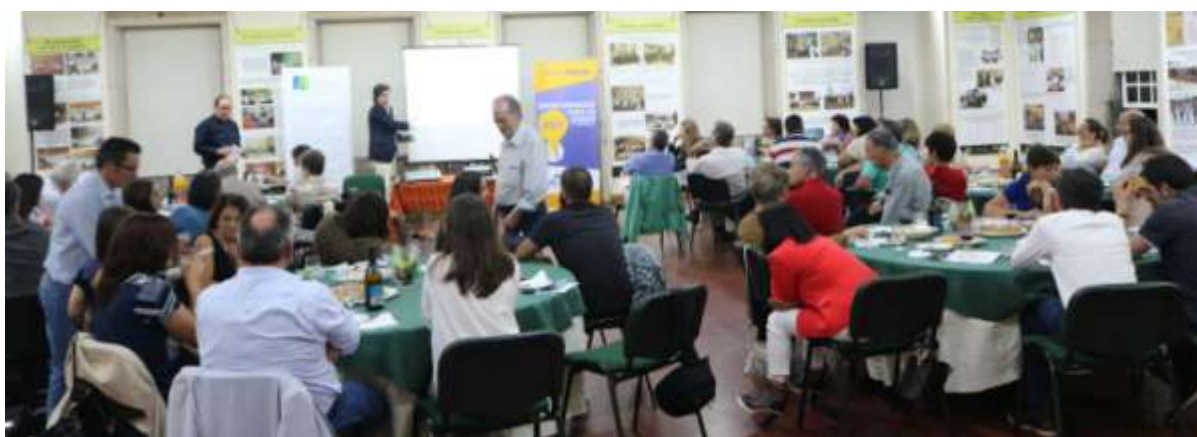
Evento final nacional do Projeto, Santa Maria da Feira, 21 de julho