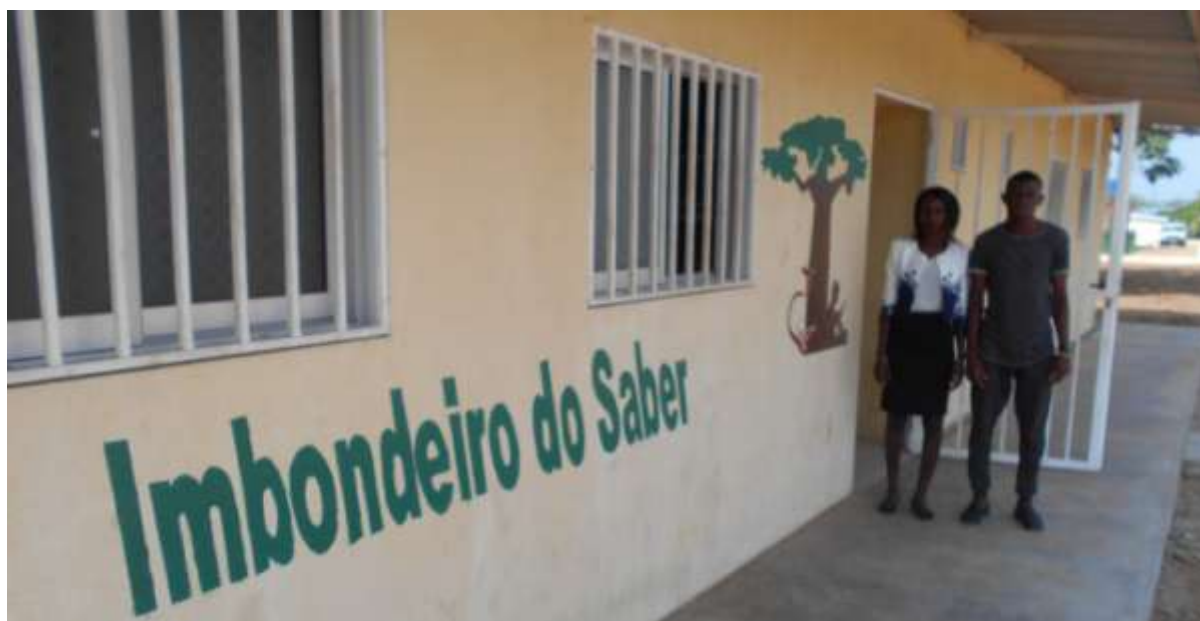
Animador e animadora da Biblioteca Imbondeiro do Saber, Centro de Recursos Educativos do Calumbo

Durante o ano de 2017 foi-se aprofundando a colaboração com os Missionários Passionistas de Calumbo - Angola no apetrechamento de uma Biblioteca, onde duas voluntárias colaboraram ativamente numa primeira dinamização, e procurou-se mobilizar recursos através de um projeto financiado que vise a criação no futuro de um Centro de Recursos Educativos no Calumbo.