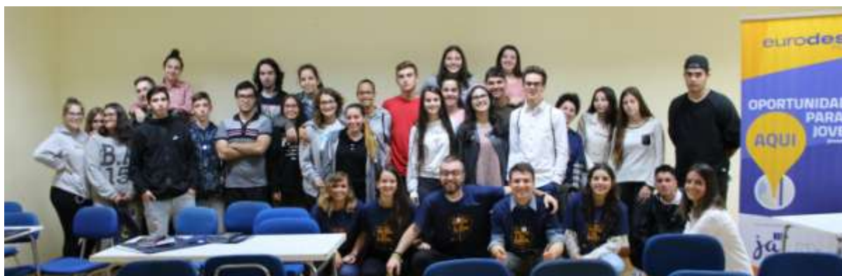
Atividade “Speed Europe”, Escola Profissional de Paços de Brandão

abrigo do Programa, e contou com o apoio na dinamização de 6 jovens voluntários SVE e 2 jovens com experiências de mobilidade.